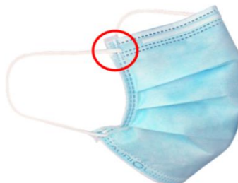
Finition « Confort + » Présence d'une doublure latérale => Plus doux & confortable