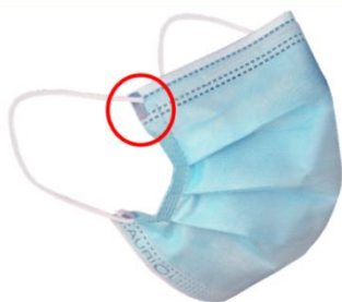
Finition « Standard »